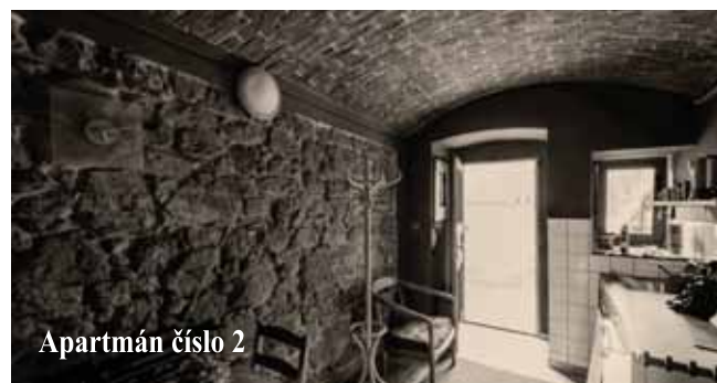
Apartmán číslo 2

Nabízíme tři čtyřlůžkové samostatné apartmány z nichž každý je vybaven koupelnou i kuchyňkou, TV i WIFI. V areálu se nachází i dva venkovní a jeden vnitřní gril. Parkování je možné zdarma ve dvoře tohoto Selského statku.