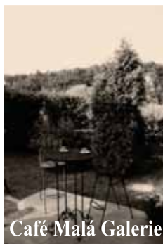
Café Malá Galerie