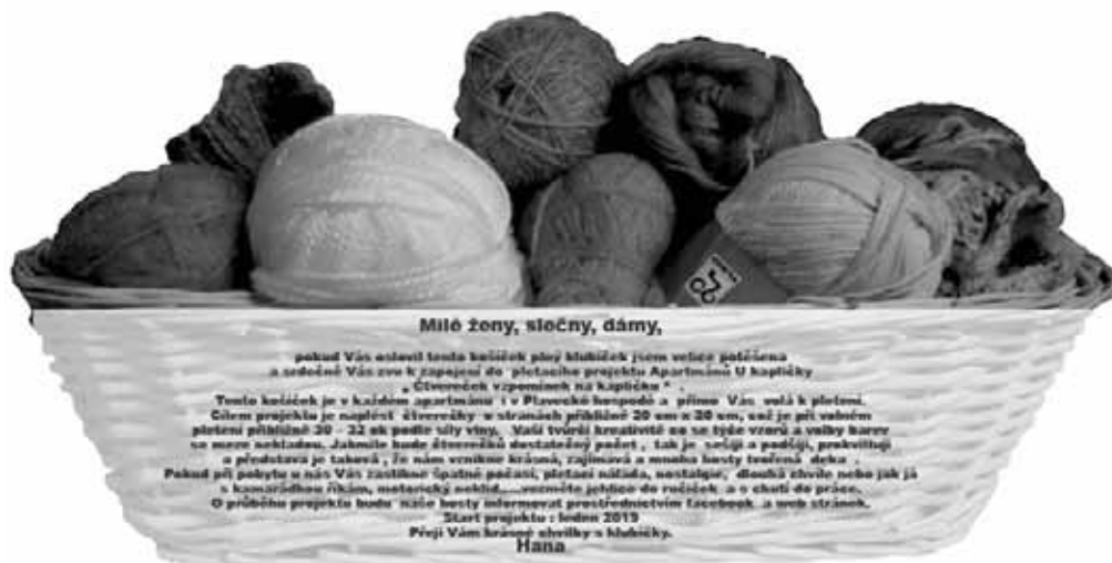
Milé ženy, sločny, dámy,

pokud Vás osloví tento košíček plný klubíček jsem velice potěšena a sebeděle Vás zvu k zapojení do pletacího projektu Apartmánů U kapličky „Čtvereček vzpomínek na Kapličku“. Tento košíček je v každém apartmánu i v Plavecké hospodě a přívaz Vás volá k pletení. Cílem projektu je naplést čtverečky v stranách přibližně 20 cm x 20 cm, což je při volném pletení přibližně 20 - 22 ok podle síly vlny. Máte tvůrčí kreativitu na se také vyzrát a velký kus na sebe schytat. Jakmile bude čtverečků dostatečný počet, tak je složi a podšiji, prokviťte a představa je taková, že nám vznikne krásný, zajímavý a mnoha hosty tvořený přehoz. Pokud při pobytu u nás Vám zastihne špatné počasí, pletací nálada, nostalgické vzpomínky, dlouhá chvíle nebo jak já s kamarádkou říkám, motorický neklid... vezměte jehlice do ručiček a s chutí do práce. Start projektu: leden 2019 Stav projektu v dubnu 2020 Start projektu: leden 2019 Stav projektu: duben 2020 První Vám krásný stříbrný s klubíčky. Hana