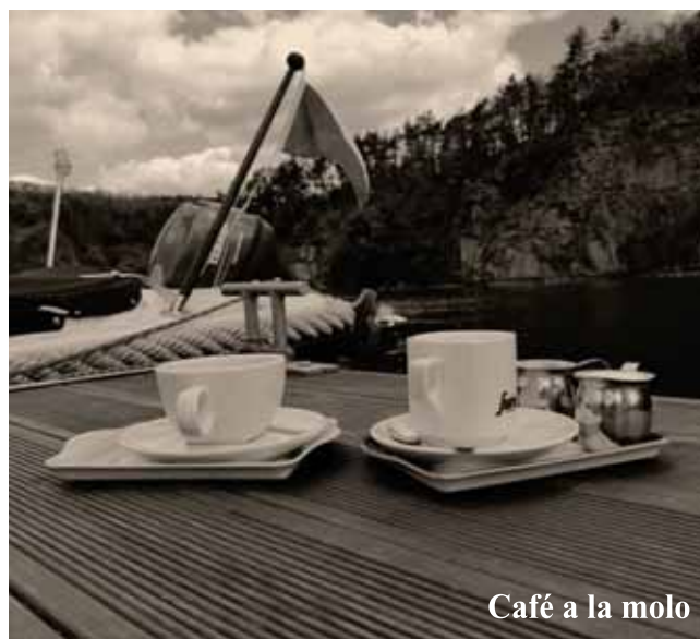
Café a la molo

V roce 2019 js me zprovoznili na břehu Slapské přehradu u hřiště nové privátní molo.