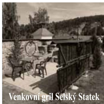
Venkovní gril Selský Statek

Chceme být místem Vašeho odpočinku a zastavení.