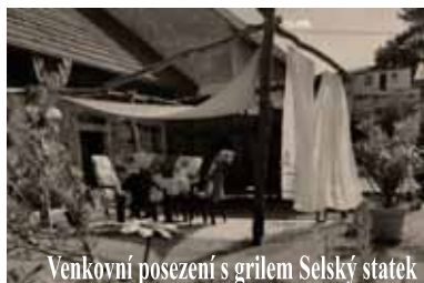
Venkovní posezení s grilem Selský statek