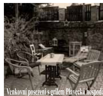
Venkovní posezení s grilem Plavecká hospoda

Přejeme Vám hezký a zdravý spánek jako u babičky v českém krepovém povlečení ze 100% bavlny.